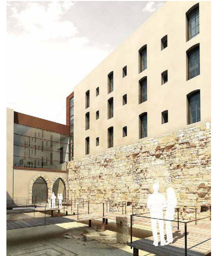
Imatge virtual del pati de Ca l'Agapito.

Finalment, la coberta es destinarà a ubicar-hi les màquines de climatització i s'hi instal·laran plaques solars.