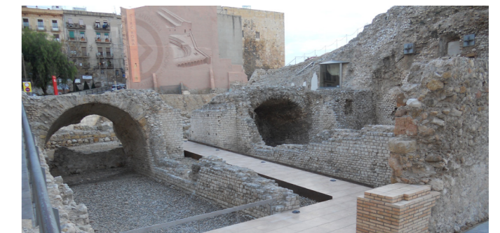
A la capçalera del Circ s'hi ha eliminat les barreres arquitectòniques.