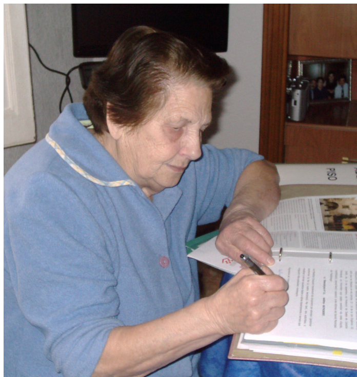
Una veïna, fent el qüestionari del Programa d'Atenció Global a la Gent Gran.