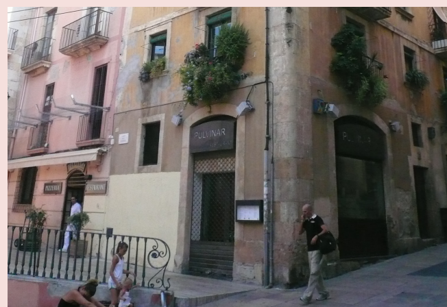
La façana del carrer Major, número 2, ha estat reformada. A l'esquerra s'observa el seu estat anterior a la intervenció i, a la dreta, l'actual.