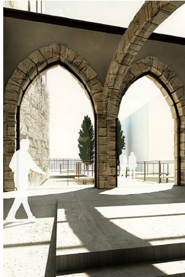
Imatge virtual de Ca l'Agapito.

L'edifici, a més, s'ha concebut com un equipament respectuós amb el medi ambient, pel que fa a sostenibilitat i eficiència energètica. Així, comptarà amb un sistema de control energètic centralitzat que permetrà que l'edifici s'autogestioni i prengui les decisions més eficients de cara a l'estalvi d'energia. S'utilitzarà l'energia solar per a l'escalfament d'aigua sanitària, s'aprofitarà les aigües pluvials de les cobertes per al rec de les jardineres del pati, s'aprofitarà la llum natural, i s'utilitzarà materials no contaminants, entre altres mesures.