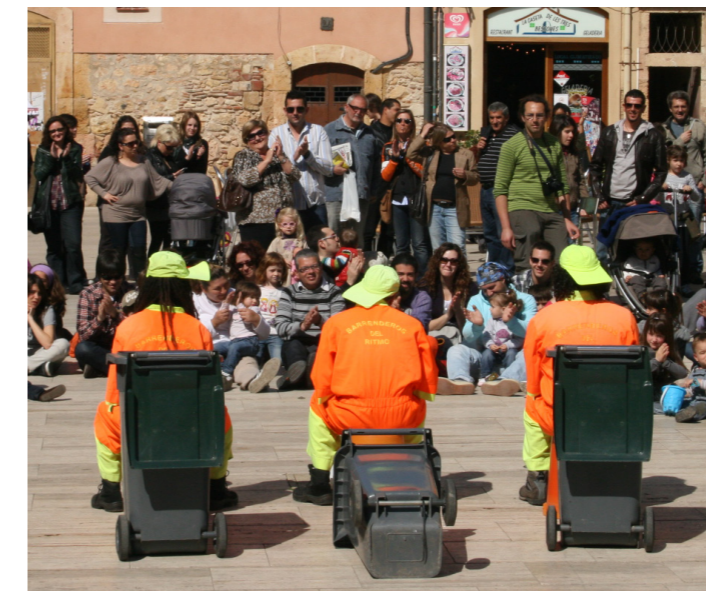
Brossaires del ritme van donar un toc alegre i musical a la Plaça del Fòrum.

Les actuacions del diumenge van prosseguir amb l'espectacle 'Zia Guantazo' a la Sala Trono i, ja a la tarda i al mateix escenari, es va representar 'La rateta'.