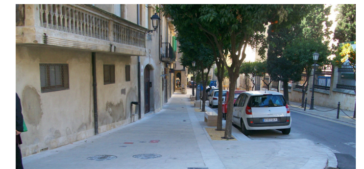
La vorera del carrer les Coques és una de les moltes arranjades.