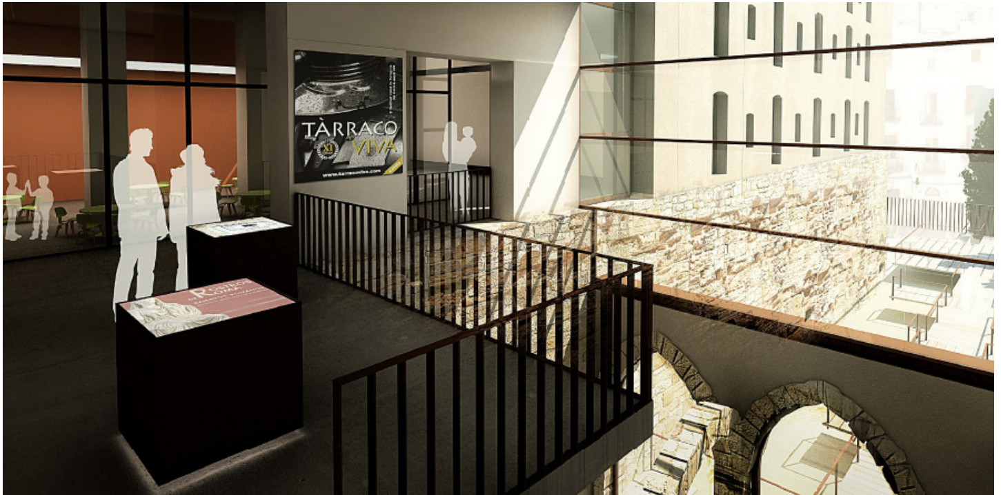
Sant Domènec acollirà aquest conjunt sociocultural. A la imatge es mostra el futur resultat de l'actuació prevista.

Des de la seva creació, el Pla Integral de la Part Alta ha activat un ampli ventall d'iniciatives i propostes per a millorar aquesta zona de la ciutat