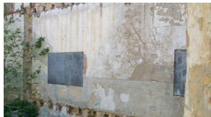
L'edifici conserva les pissarres de l'antic col·legi de les dominiques.

el conjunt es troba en un estat de degradació força considerable, però encara s'hi poden distingir les diferents parts del convent-beateri, com les cel·les de les monges dominiques o les aules d'ensenyament, on s'hi observen les pissarres a les parets.