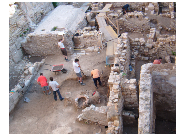
Actualment s'està treballant en les cales arqueològiques.

En aquest sentit, s'està treballant en les cales als revestiments interiors, tant de la part de l'església com dels envans i parets interiors, amb l'objectiu de comprovar l'estat en què es troben i si són restaurables, per a així poder determinar els següents passos a desenvolupar en el projecte de creació del conjunt sociocultural.