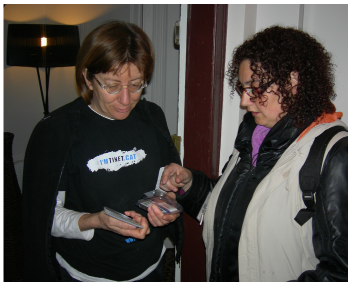
Una de les educadores contractades pel PIPA, durant la campanya d'estalvi i ús responsable de l'aigua

Al mateix temps, els vuit educadors ambientals també duen a terme una campanya d'estalvi i ús responsable de l'aigua, l'objectiu de la qual és conscienciar la població de la necessitat de no malgastar l'aigua. En aquest sentit, mitjançant la visita porta a porta pels domicilis del barri, els educadors reparteixen economitadors d'aigua per a les aixetes.