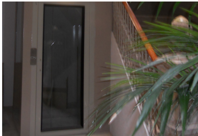
El número 35 del carrer Major ja gaudeix del seu nou ascensor.

Els veïns de la Part Alta interessats en acollir-se a aquest programa de subvencions poden informar-se i realitzar les seves sol·licituds dirigint-se a les Oficines del Servei Municipal de l'Habitatge i Actuacions Urbanes (SMHAUSA), ubicada al carrer Descalços, 15, o bé trucar al telèfon 977 244 056, o visitar la pàgina web www.tarracohabitatge.cat , on trobaran informació completa sobre aquest programa de millora dels immobles de la Part Alta i com poden acollir-se a aquestes ajudes.