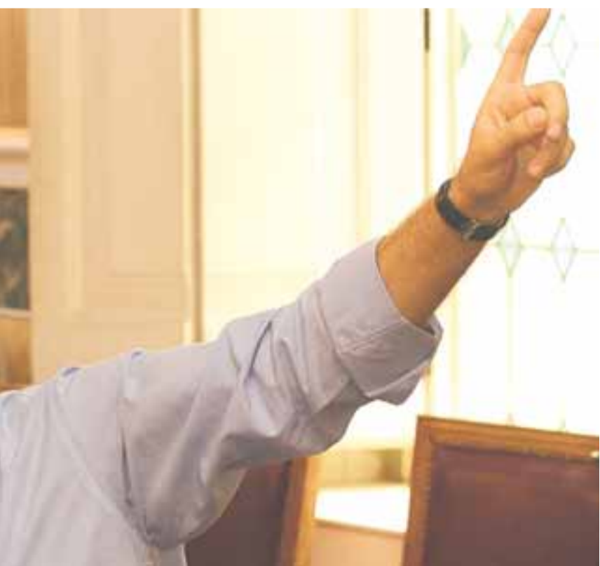
que se encuentran en el salón del palacio municipal.

- No depende sólo de mí. Creo que las televisiones locales públicas tienen poco futuro. El modelo no es bueno.