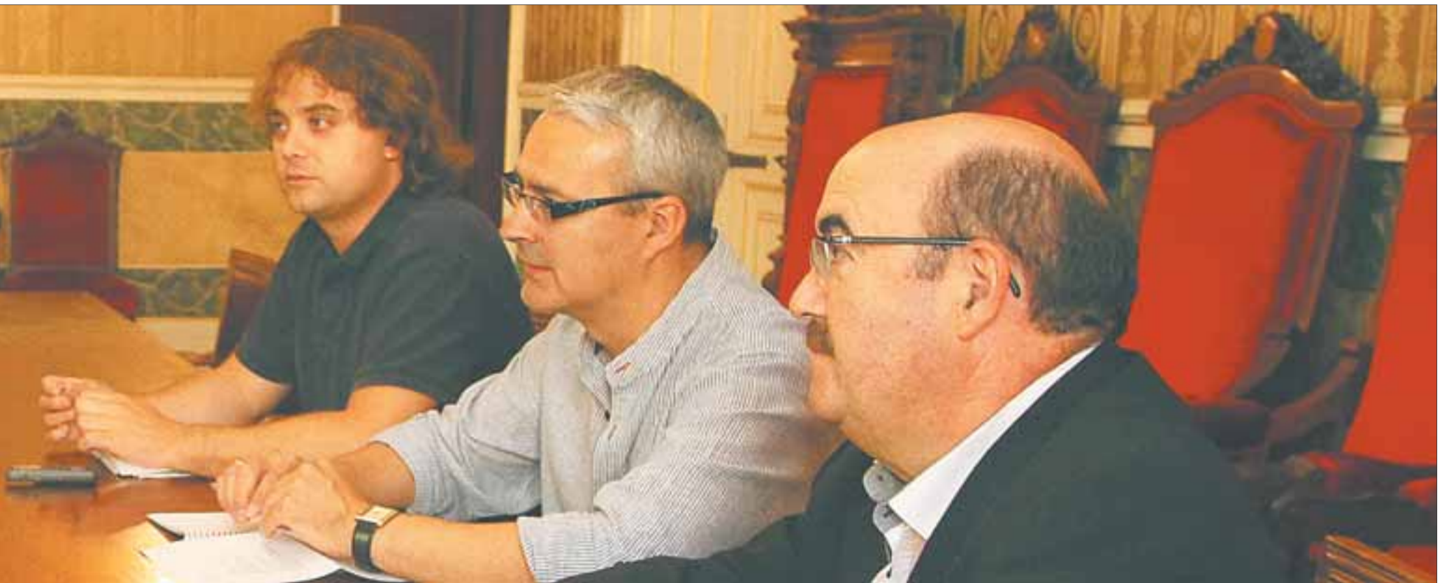
municipal con los representantes de este periódico, quienes le realizaron 55 preguntas en el encuentro que se llevó a cabo en el Saló dels Penjats del edificio de la Plaça de la Font.

- Alguien debe asumir las responsabilidades en este caso. - Sí, pero esto lo deciden los jueces. Nosotros hicimos una auditoría, que pasamos al fiscal y él la pasó al juzgado. Espero que haya responsabilidades de todo tipo.