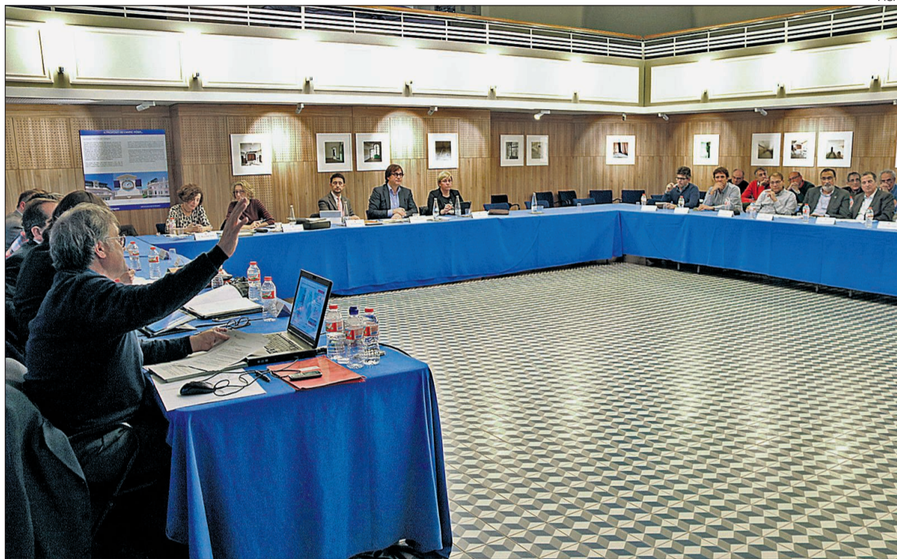
Ahir a la tarda va tenir lloc al teatre de l'edifici del Pòsit de Pescadors la reunió de la Comissió d'Urbanisme de Tarragona.

Amb aquesta aprovació provisional, el PDU encara la recta final de la seva tramitació. Està previst que avui el Consorci del CRT faci l'informe previ favorable i, demà, la Comissió de