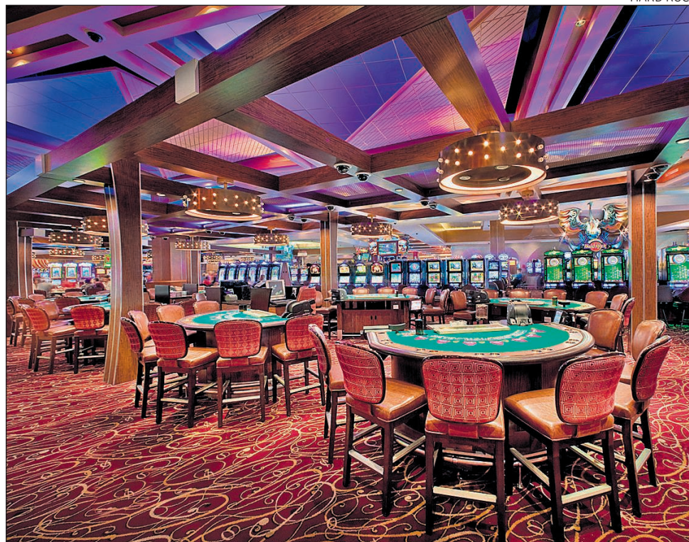
Interior del Seminole Hard Rock Hotel & Casino Hollywood.

Pel que fa a la zona comercial, les 75 botigues de luxe desenvolupades per Value Retail ocuparan 10.000 metres quadrats de sostre, si bé el Pla Director Urbanístic (PDU) en preveu fins a 50.000. El mateix passa amb el nombre d'hotels, que també tenen marge per créixer. El PDU preveu com a màxim 425.000 metres quadrats de sostre, mentre que l'hotel de 600 habitacions desenvolupat per Hard Rock, que tindrà forma de la icònica guitarra de la cadena, ocuparà 100.000 metres quadrats, i el segon hotel, el de Port Aventura, serà més petit, de 500 habitacions.