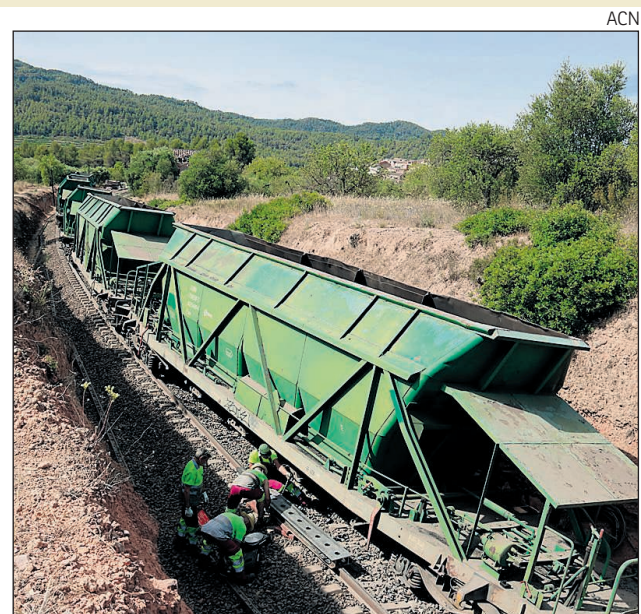
Imatge de divendres del comboi descarrilat a Capcanes.

ballat aquest cap de setmana per condicionar la via afectada i reparar els danys a la via i a la catenària. El descarrilament es va produir cap a les sis de la tarda de dijous i una part dels vagons afectats es van quedar a