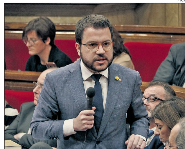
Pere Aragonès durant la seva intervenció al Parlament.

Govern va treure ferro a la concessió de la pròrroga, tot assegurant que «si tira endavant», no suposarà cap risc financer per a la Generalitat, en relació a la transacció de terrenys, ja que Incasòl ha de comprar-los a La Caixa i tot seguit vendre'ls a l'empresa nord-americana.