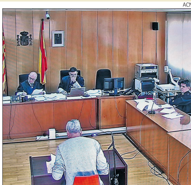
El sotsinspector que va declarar ahir (d'esquenes).