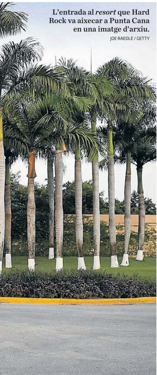
L'entrada al resort que Hard Rock va aixecar a Punta Cana en una imatge d'arxiu.

Les carreteres catalanes van registrar ahir cues de més de 15 quilòmetres a les entrades de Barcelona. El cap de setmana van sortir de l'àrea metropolitana més de 424.000 vehicles, un 36,1% més que l'últim cap de setmana d'agost.